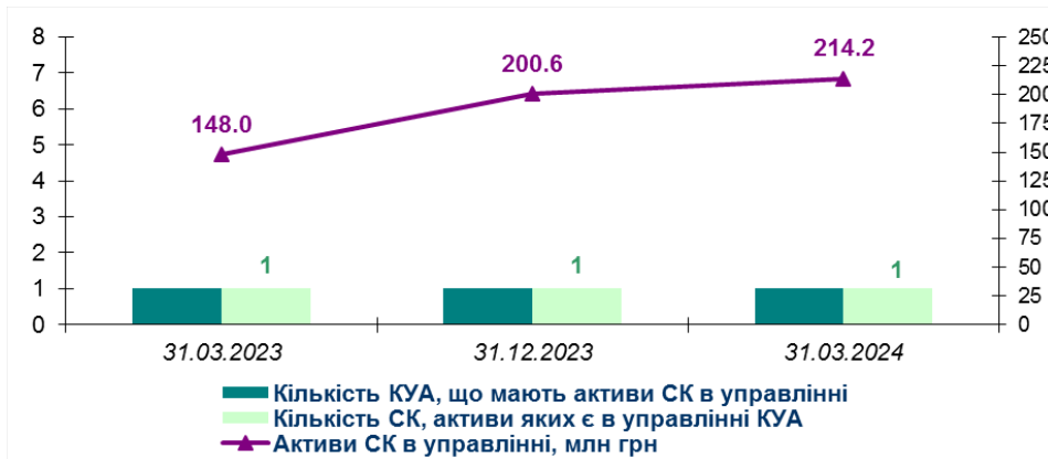
Рис. 1. Динаміка управління активами СК у 1-му кварталі 2023-24 рр.

Кількість СК, що передали активи в управління КУА, залишалася незмінною третій рік поспіль: на кінець березня 2024 року одна КУА мала в управлінні активи однієї СК .