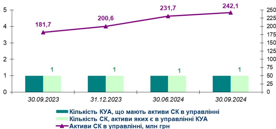
Рис. 1. Динаміка управління активами СК у 3-му кварталі 2023-24 рр.

Кількість СК, що передали активи в управлінні КУА, залишалася незмінною третій рік поспіль: на кінець вересня 2024 року одна КУА мала в управлінні активи однієї СК .